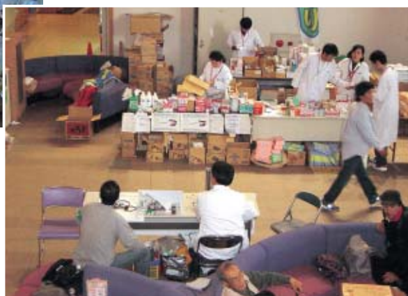
小千谷市総合体育館に設置した歯科 ブースで全国からの支援物資を配布