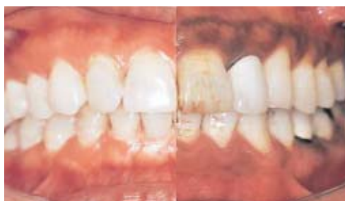
左：非喫煙者 右：喫煙者 (写真1)

では、喫煙はどうして歯ぐきに良くないのでしょうか？喫煙者のお口の写真（写真1右）を見てもらうとわかりますが、喫煙によって歯ぐきは黒ずみ、お口の歯周病の原因となる細菌も増えやすく不潔になっています。しかもっと悪い事は、私たちの研究でも調べていますが、喫煙が身体を守るための免疫力やそのもとになる白血球などの免疫細胞の働きを傷害する事がわかったのです。この喫煙による免疫力の傷害は、お口の中だけでなく全身の免疫にも影響して、全身の癌や脳・肺・心臓など全身の致死的な病気の原因にもなっているのです。