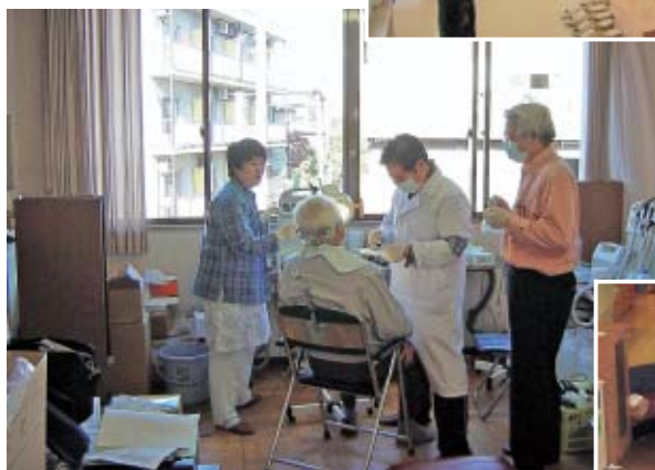
小千谷市総合保健センター内に 設置した歯科医療救護センター