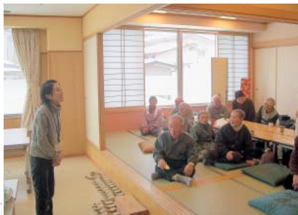
仮設住宅における口腔ケア 事業にて