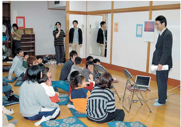
写真2 歯科保健に関する親子体験学習会：「まなび屋」というフリースクールの「まなびの時間」をお借りして、子供たちと遊びながら交流を深めつつ、少しずつ歯の話をしていきました。別室では保護者の方々ともお話をしています。