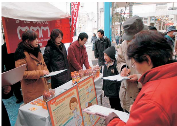
写真1 新潟食の陣への参加：当日は雪の吹き込んでくる中、多くの方々に足を止めていただきました。協力していただいたアンケートは実に1200枚に上ります。

は～もに～ぷろじえくとは手探りながらも、「住民参加型歯科保健」に向けて進んでいます。今は様々な立場の方から少しでも多くの意見をいただきたいと思っています。興味のある方は是非一度、お声掛けください。