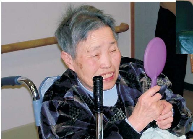
要介護者の口腔内実態調査にて