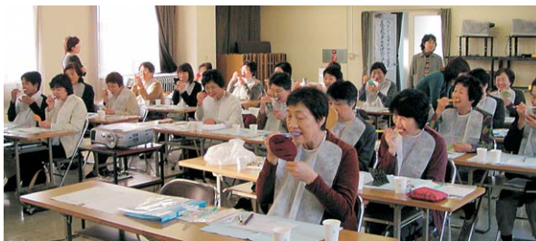
10/21 スタンダードコース 長岡会場にて

スタンダードコース(28会場)・個別健康教育コース(5会場)・集団健康教育実践コース(50会場)の3コースで実施しています。